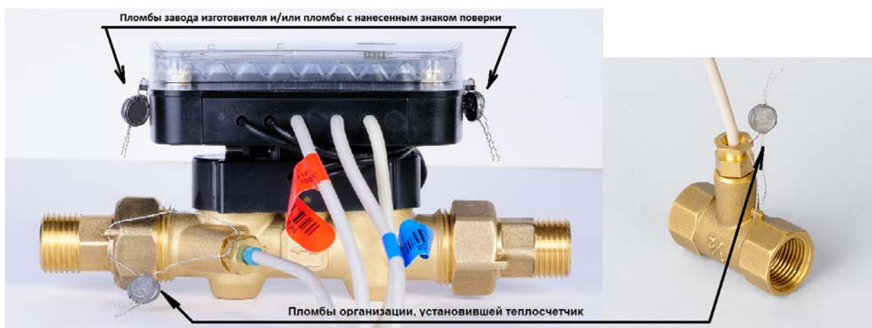
Рисунок 2 – Схема пломбировки теплосчетчика