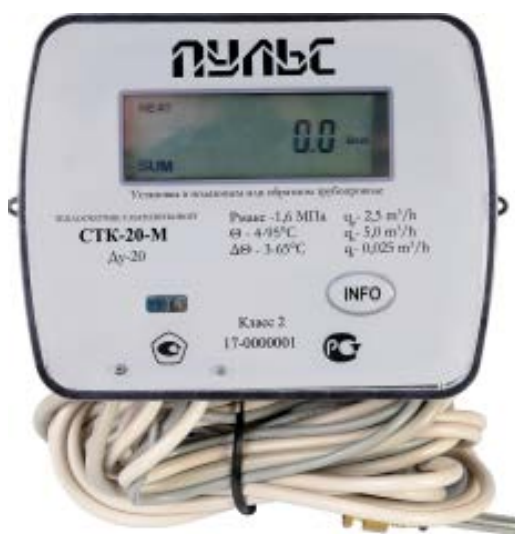
Рисунок 1. Внешний вид теплосчетчика.